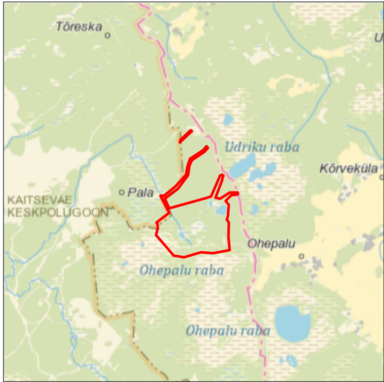
Kaardileht nr 643 Tapa